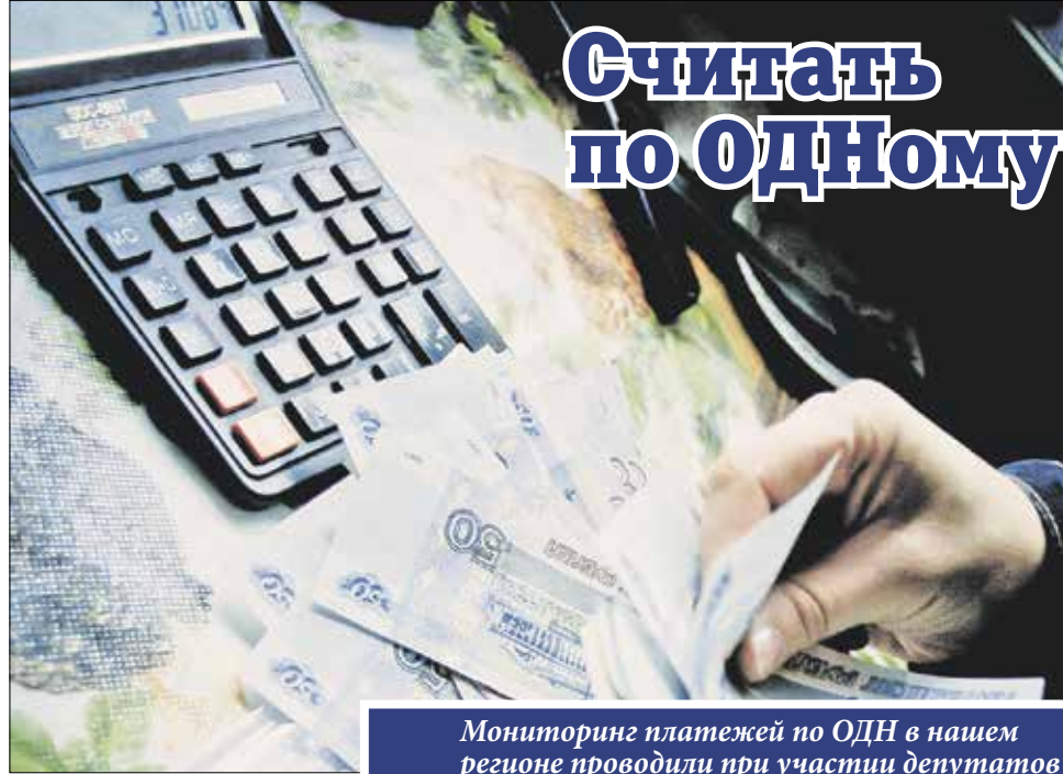
Мониторинг платежей по ОДН в нашем регионе проводили при участии депутатов Госдумы из фракции «Единая Россия»

— Проблема в том, что поставщик ресурсов (воды, электроэнергии) рас-